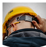
Fácil de ajustar

Apriete o afloje fácilmente el casco gracias al trinquete en la parte trasera.