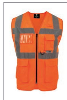
KXEXQO Naranja (Frente) S - 5XL