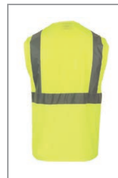
KXEXQG Amarillo (Posterior) S - 5XL