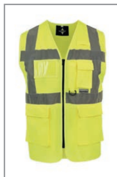
KXEXQG Amarillo (Frente) S - 5XL

Industria, transporte y logística, construcción, autoridades, aeropuertos