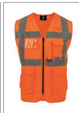
KXEXQO Arancione S - 5XL