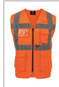
KXEXQO Orange (Vorne) S - 5XL